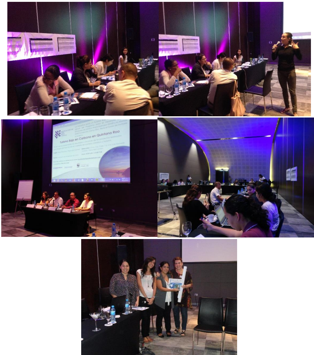
Figura 3. Imágenes del evento "Turismo y Cambio Climático" llevado a cabo en el Hotel Paradisus Playa del Carmen, el 6 de diciembre de 2013.

En la Tabla 4 se presentan los resultados de los dos talleres organizados por Amigos de Sian Ka'an. La primera columna indica a qué subsector se refieren las medidas de mitigación que se encuentran enlistadas en la segunda columna (las medidas son las que resultaron "factibles" según el análisis realizado en el primer taller). En las últimas tres columnas se presentan los resultados del segundo taller, en donde se desarrollan las metas a corto (2-5 años), mediano (5-10 años) y largo (10-20 años) plazo.