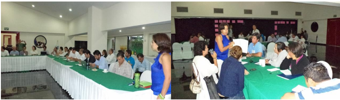
Figura 1. Imágenes del Taller de Medidas de Mitigación y Adaptación al Cambio Climático para el sector turístico (Organizado por Amigos de Sian Ka'an con apoyo de la Alianza WWF-Fundación Carlos Slim en Cancún, Quintana Roo en el mes de Octubre de 2012)

En cuanto al análisis de medidas de mitigación y adaptación al cambio climático para el sector, Amigos de Sian Ka'an organizó el Taller de Mitigación y Adaptación al Cambio Climático para el sector turismo, en donde enlistó las medidas de mitigación planteadas por el PNUMA, las cuales se pusieron a disposición de mesas de trabajo para cada subsector (hospedaje, transporte y tour operadores). Los participantes las analizaron y agregaron medidas adicionales que según su experiencia, consideraban pertinentes. Posteriormente calificaron una por una de acuerdo a su viabilidad e impacto. La calificación permite generar una priorización de medidas, de tal forma que sea fácil identificar las medidas que son más viables (o más fáciles de implementar) y que tienen un mayor impacto tanto en la gente, como en la cantidad de emisiones que reducen 3 .